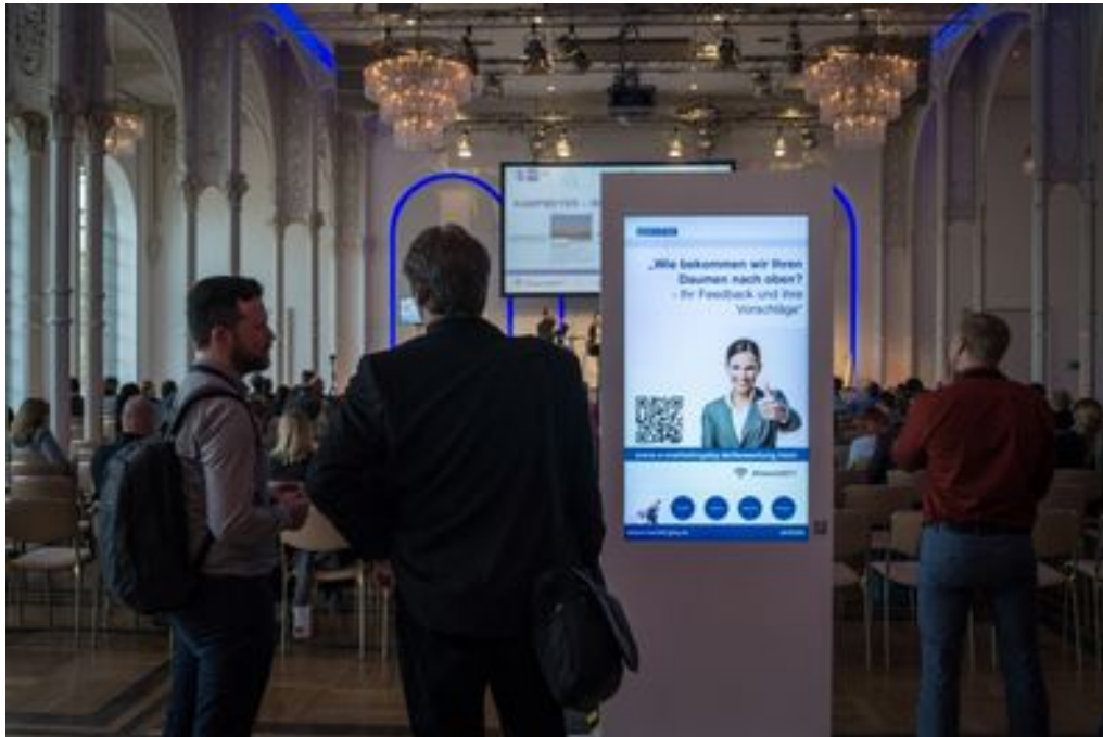
Die Digital Signage Softwarelösung kompas von dimedis im Einsatz: Interaktives Digital Signage am POS

Ein Video des eMarketingdays in Köln ist hier zu sehen (YouTube):