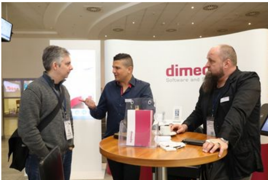
dimedis-Stand beim eMarketing Day

Besucher der Veranstaltung können auf dem gesamten Gelände einige kompas-Mietstelen nutzen. Die Mietstelen sind mit einem 55 Zoll Touch-Monitor und in der Grundausstattung mit der Digital Signage Softwarelösung kompas ausgerüstet, welche für die