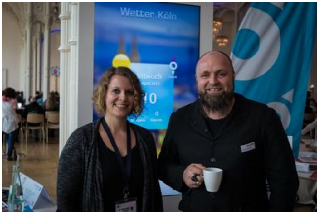
Erneut unterstützt dimedis den eMarketing Day und ist Aussteller vor Ort

PRESSEMITTEILUNG – Zur sofortigen Veröffentlichung