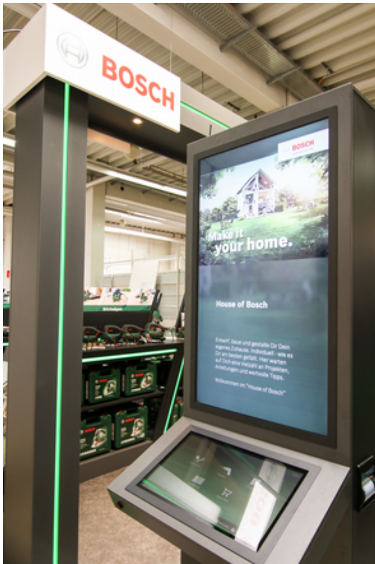
Interaktive Stele der Bosch Experience Zone