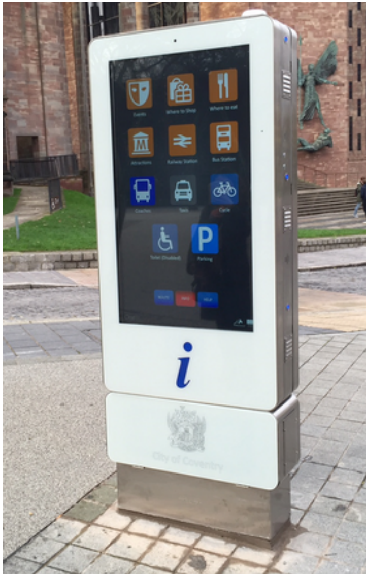
Interaktive Stele für Städte und Kommunen

Möglichkeit, die interaktiven Outdoor-Stelen und kompas wayfinding für Städte und Kommunen live zu erleben.